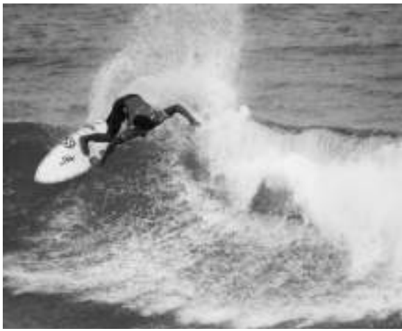
▲サーフィンがきっかけで移住する人も多い

浦邊 本町においても、様々な職種で人手不足となっており、若者を必要としている。若者定住につながる具体的な対策は、