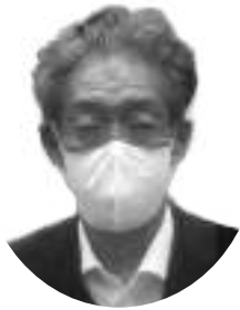
北之園 千春 教育長