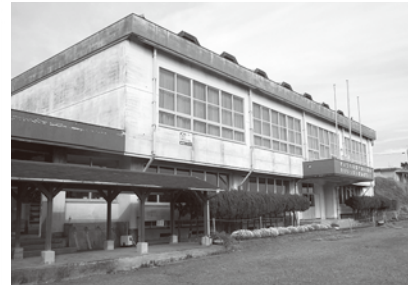
▲星原小学校体育館