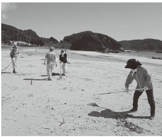
▲暑い中での清掃作業

今後、SDGsを、身近なボランティア活動として取り組んでいきます。ぜひ、きれいになった熊野海水浴場を楽しんでください。