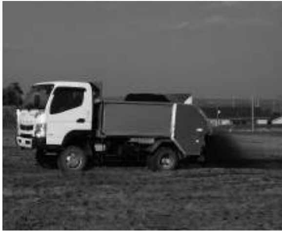
▲土づくりは堆肥が基本

町長 堆肥の生産が可能な施設整備も近い将来必要であると考えます。肥料高騰、これも視野に入れ関係機関に