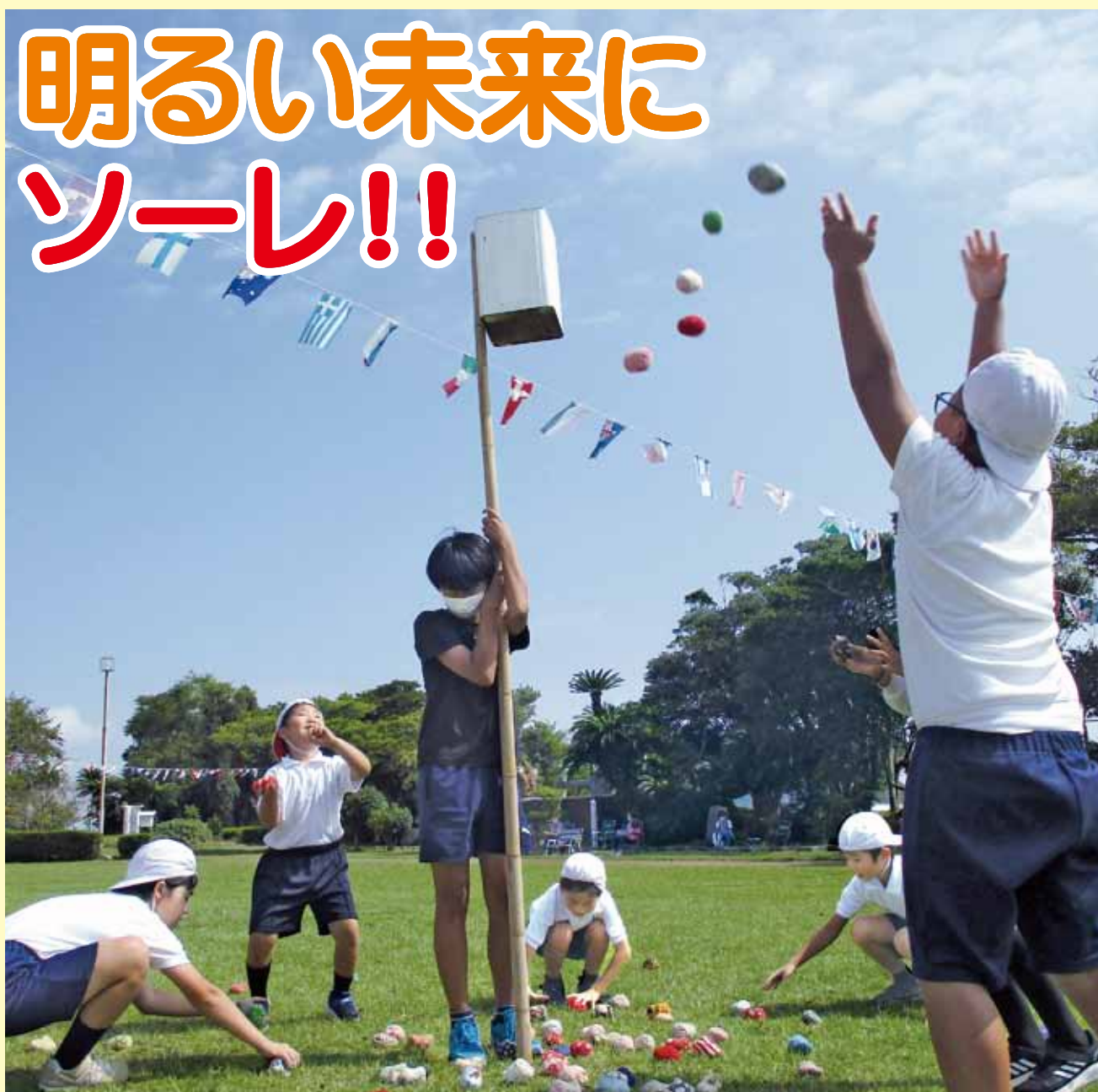
南界小学校運動会