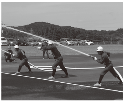
▲県消防操法大会での様子

8月26日開催の、「鹿児島県消防操法大会」において、熊毛支部代表として出場した本町の中央分団が、ポンプ車の部で優勝しました。