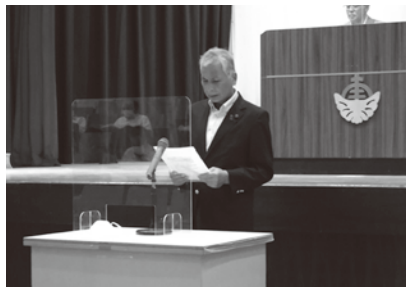
▲趣旨説明をする迫田議員