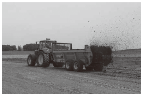
▲堆肥施用 (微生物による発生残渣の分解促進)