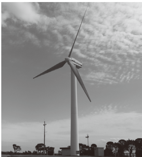
▲11月から解体がはじまります