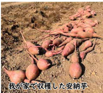
我が家で収穫した安納芋