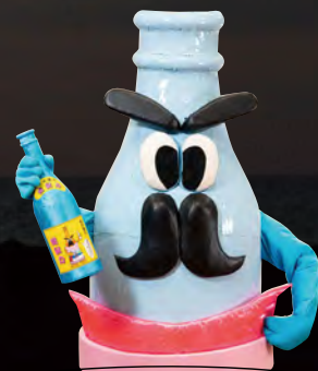
焼酎力(しょうちゅうりき)

甘い言葉をささやく、島内唯一の 製糖工場のマスコットの存在。 のまん神と大の仲良し♡