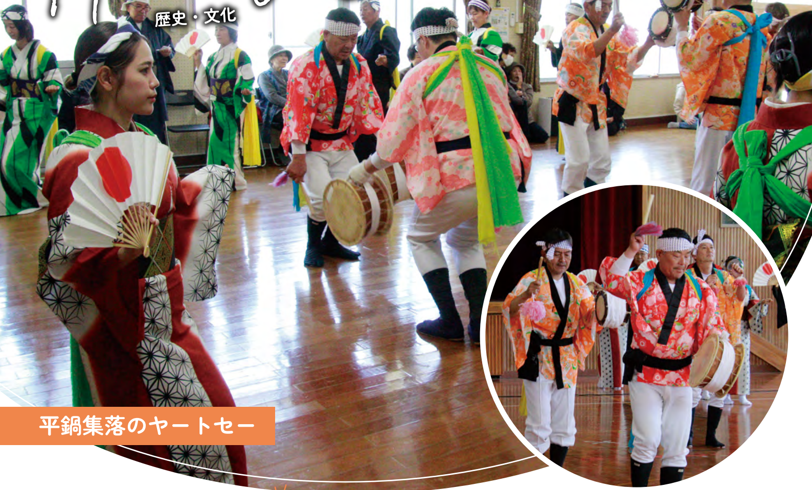
平鍋集落のヤートセー