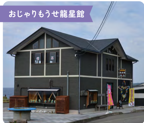
おじゃりもうせ龍星館