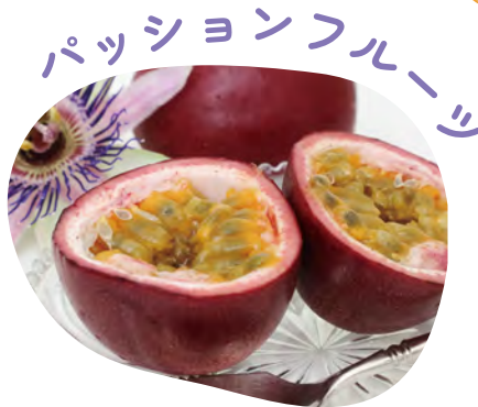
パッションフルーツ