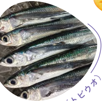
トッピー(トビウオ)