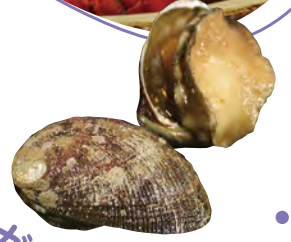
メガラメ(トコブシ)