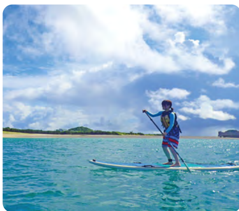
まるで海の上を歩いているかのような 体験ができるSUP