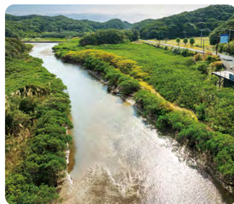
国の天然記念物に指定されている 大自然の宝庫 マングローブ林