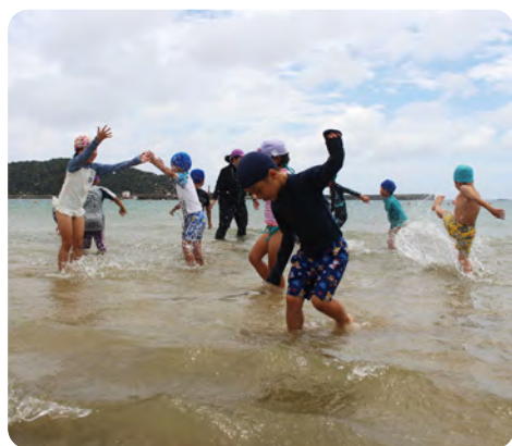
家族や友人・恋人と楽しめる 熊野海水浴場

中種子町には、とっておきの穴場がある。種子島特有の砂岩がつくり出したダイナミックな岩肌と波打ち際に連なる岩。透き通ったエメラルドグリーンの海にアクセントのように浮かぶ無人島。そして貴重な動植物が生育するマングローブの大群生。熊野海岸一体は、まるで外国のような景観が広がる。夕方になり、沖合の島々に西日が差し込むと景色が一変。幻想的な色彩に彩られ、夜は満天の星空を眺めながらただただ癒されることだろう。今では、国内だけでなくSNSなどで拡散された絶景を目当てに外国人観光客も年々増加している。