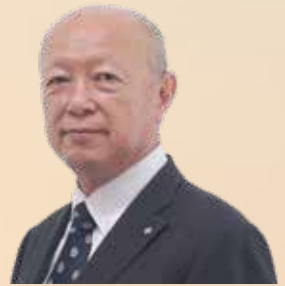
町長 田淵川 寿広