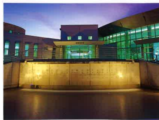
屋外ステージにもなるこりーなの滝