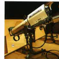
クセノンスポットライト (2台)