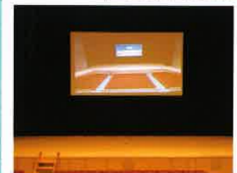
300インチプロジェクター用スクリーン