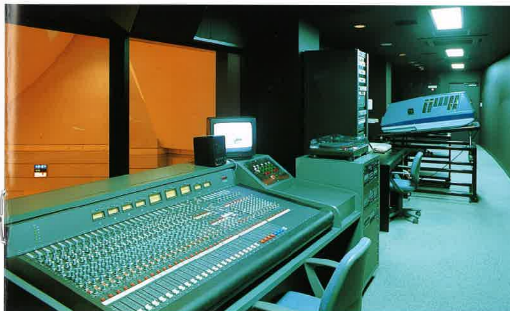
音響・照明調整室