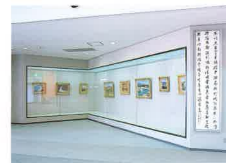
ロビー展示コーナー