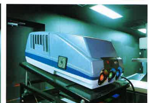
ハイビジョン対応スーパープロジェクター