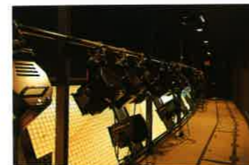
シーリングライト (24台)