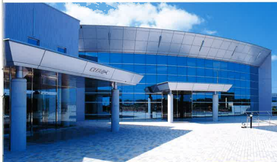
種子島こりーな玄関