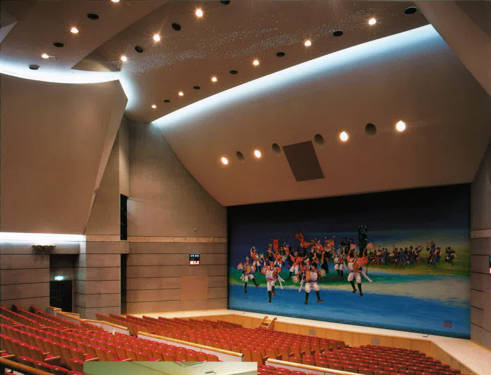
ホールと観覧・天井には光ファイバーで星空を再現する