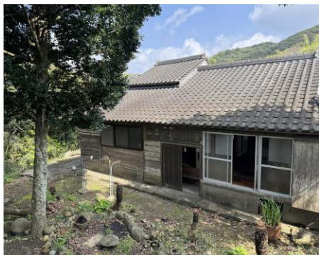
< 外観 >