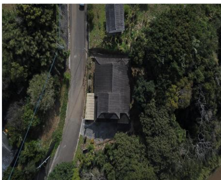
< 空撮 >