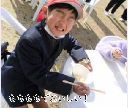
もちもちでおいしい!