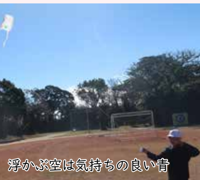
浮かぶ空は気持ちの良い青