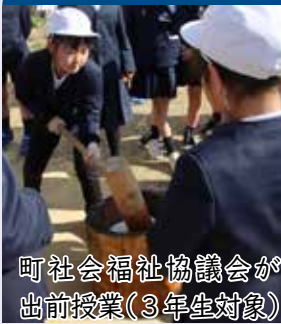
町社会福祉協議会が 出前授業(3年生対象)