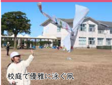
校庭で優雅に泳ぐ凧