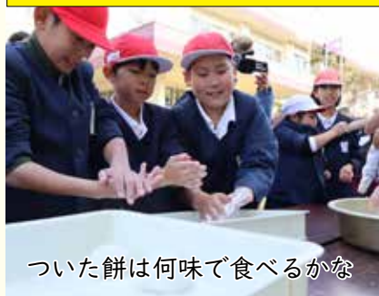
ついた餅は何味で食べるかな