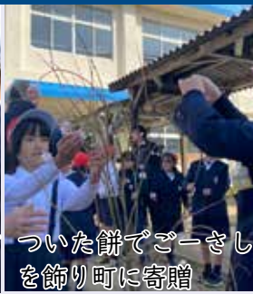
ついた餅でござし を飾り町に寄贈