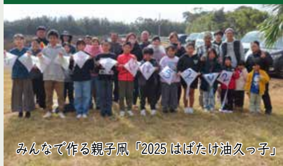
みんなで作る親子凧「2025 はばたけ油久っ子」