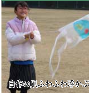
自作の凧ふわふわ浮かぶ