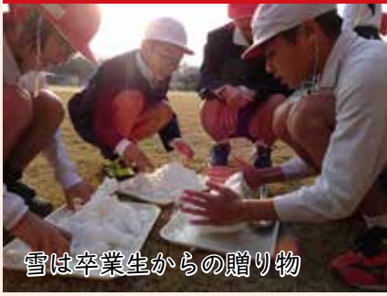
雪は卒業生からの贈り物