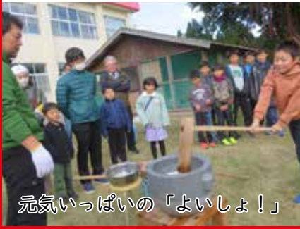
元気いっぱいの「よいしょ！」