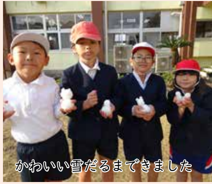
かわいい雪だるまできました