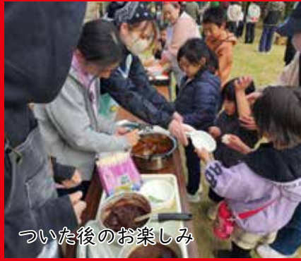
ついた後のお楽しみ