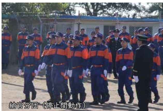
納官分団（停止間動作）