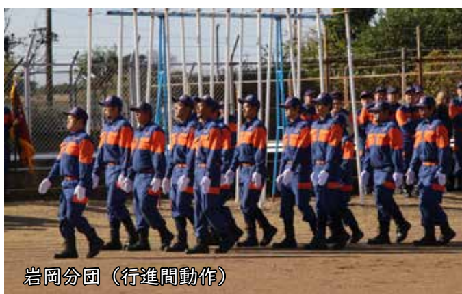
岩岡分団（行進間動作）