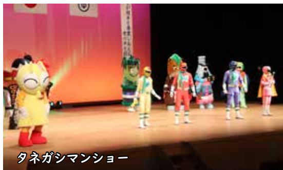
タネガシマンショー