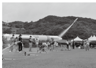
「水ロケット打ち上げ体験」の様子

この度は安全なイベント運営にご協力頂きまして、誠にありがとうございました。 また、本イベントを通じて、種子島宇宙センターやJAXAが皆さまにとって少しでも身近なものとなれば幸いです。今後も種子島宇宙センターの事業を多くの方に知っていただけるよう、より一層努めてまいります。