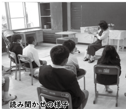
読み聞かせの様子