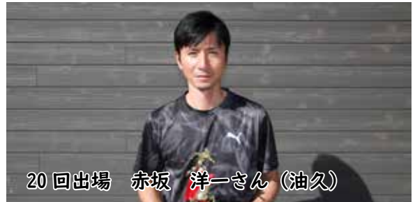
※区間記録 (色太文字) (敬称略)