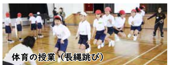
体育の授業(長縄跳び)