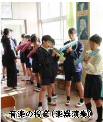
音楽の授業(楽器演奏)

11月28日に、第2回中種子町交流学习が増田小学校であり、町内の小規模6校の5年生24人と、6年生25人が参加しました。 交流会は、普段は複式学級で学ぶ児童たちが、大人数での学習や集団活動を通して、他校と交流を深め、中学校への進学に、期待感をもたせることを目的に行われています。 児童は、いつもと違う環境に最初は戸惑っている様子でしたが、授業を通して一緒に過ごす中で、次第に緊張もほぐれ、笑顔を見せるようになりました。 5年生は音楽の授業で、合唱や楽器の演奏で心を通わせました。6年生は国語の授業で俳句の作り方を習い、タブレットで季節やイラストを調べるなどして、独自の句を完成させ、互いに送り合うなどして学びと交流を深めました。