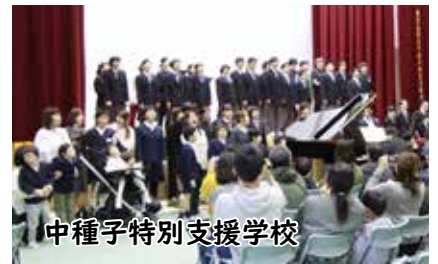
中種子特別支援学校