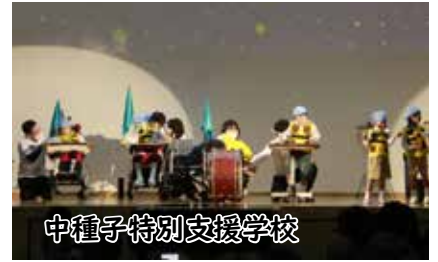
中種子特別支援学校