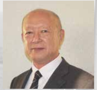
町長 田淵川 寿広