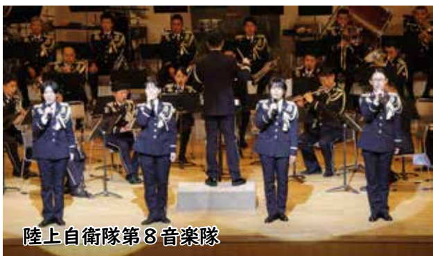
陸上自衛隊第8音楽隊

11月10日に、種子島こりーなで陸上自衛隊第8音楽隊の音楽コンサート「島しょ演奏会 in 中種子」がありました。演奏会は2部構成で、第一部では、音楽隊の奏でる音色と歌手の歌声が観客を魅了し、第二部では、種子島中央高校の吹奏楽部4人が出演し、音楽隊との共演で会場を沸かせました。演奏会の最後は、子どもたちも舞台上で踊り、会場は一体感に包まれ、楽しい音楽の輪が広がりました。