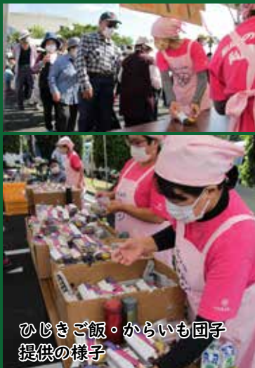
ひじきご飯・からいも団子提供の様子

また、食生活改善推進員コーナーでは、これからも皆さまの健康増進のため、健康的でおいしい献立や調理方法、食材などを紹介していきますので、ぜひご家庭でもお試しください。