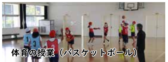
体育の授業(バスケットボール)