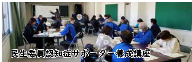
民生委員認知症サポーター養成講座

12月8日(金) 民生委員に認知症サポーター養成講座を行いました。地域で認知症の方やその家族を支えていくためにはどうしたらいいか、認知症の人への対応のグループワークでは活発な意見が出ていました。