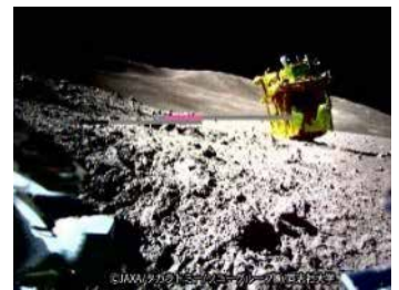
LEV-2「SORA-Q」が撮影・送信した月面画像