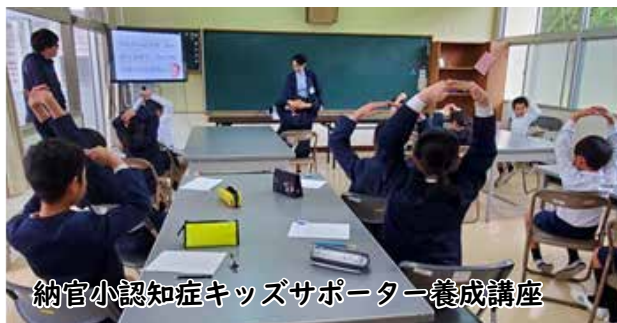
納官小認知症キッズサポーター養成講座

地域包括支援センターでは認知症に関する相談を受けています。お気軽にご相談ください。