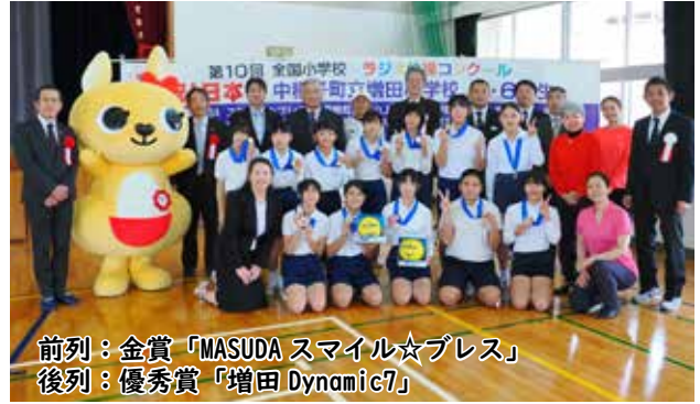
前列：金賞「MASUDA スマイル☆ブレス」 後列：優秀賞「増田 Dynamic7」

12月20日に、増田小学校の5・6年生5人で編成された「MASUDAスマイル☆ブレス」チームが、第10回全国小学校ラジオ体操コンクールで金賞を受賞し、日本一の栄冠に輝きました。金賞は今回で3度目です。また、もう一チームの「増田 Dynamic7」は優秀賞を受賞しました。 1月15日には、学校の体育館で表彰式が行われ、その後、NHKテレビ・ラジオ体操指導者とピアノ奏者、アシスタントによる出張授業も行われました。