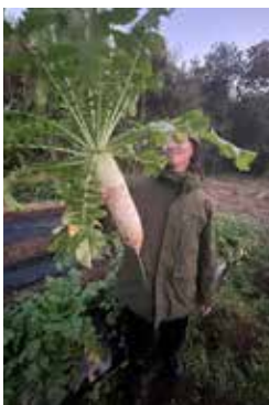
大根の収穫 家庭菜園も頑張っています