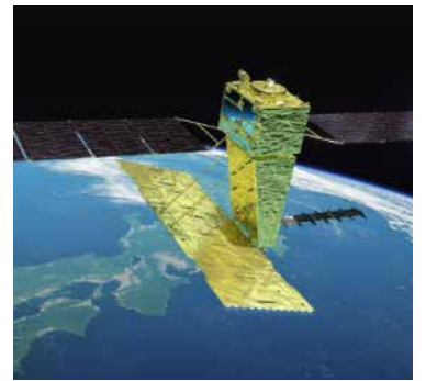
先進レーダ衛星「だいち4号」