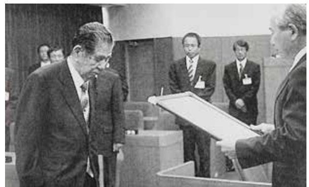
広報なかたね（平成23年7月号）から引用