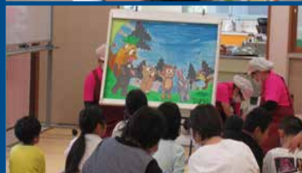
油久小学校 大型紙芝居