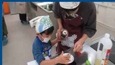
野間幼稚園 料理教室

6月は「食育月間」、毎月19日は「食育の日」 毎月第3土曜日は「かごしま活生き食の日」です！