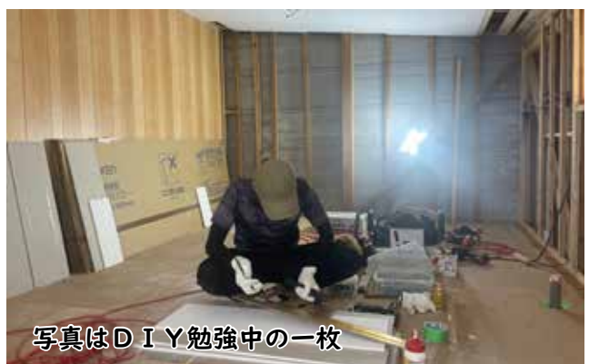
写真はDIY勉強中の一枚

（※）DIYとは、自分で何かを作ったり修理したりすることです。（家庭内の改装や修繕、家具の製作など）