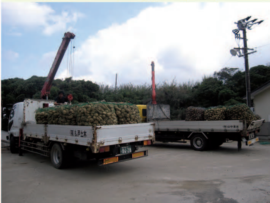
納官澱粉工場に運ばれた甘藷