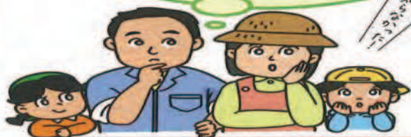
農業者年金に加入すれば～農業者年金の支給額(年額)の試算～

農業者の皆様も、メリットがたくさんある 農業者年金 に加入して安心して豊かな老後を迎えましょう。