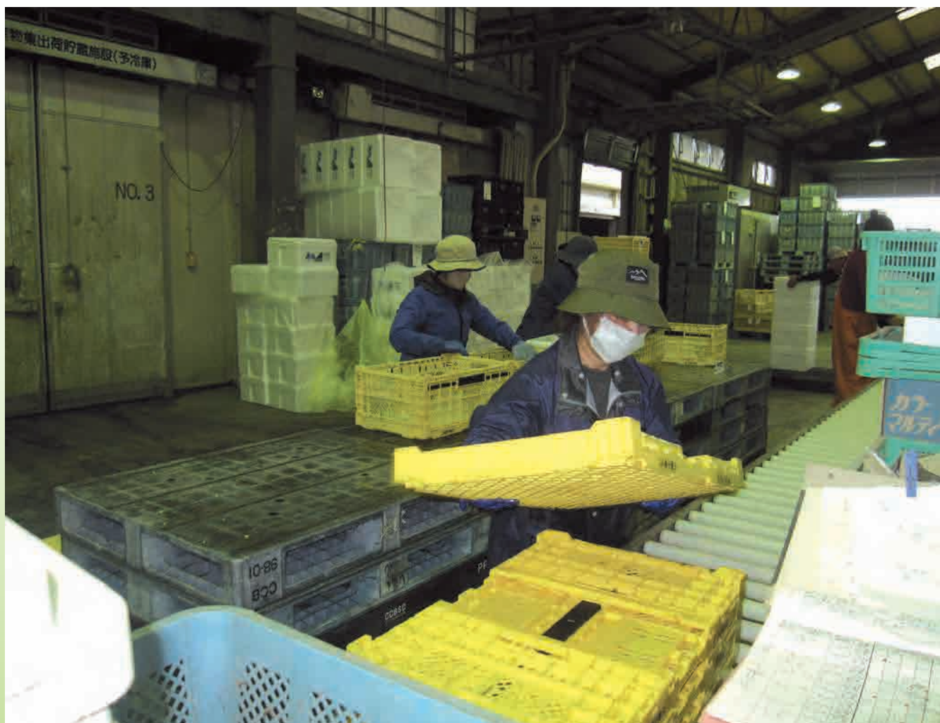
最盛期に入ったブロッコリー集荷場（種子屋久農協）