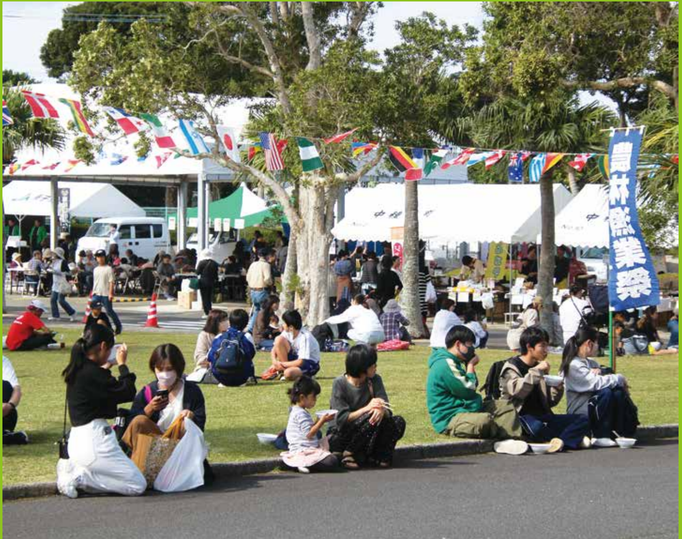
晴天に恵まれ4年ぶりに実施された農林漁業祭（令和5年11月4日）