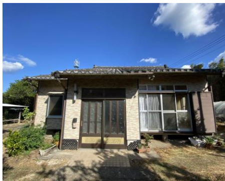
< 外観 >