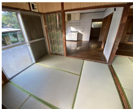
< 和室① >