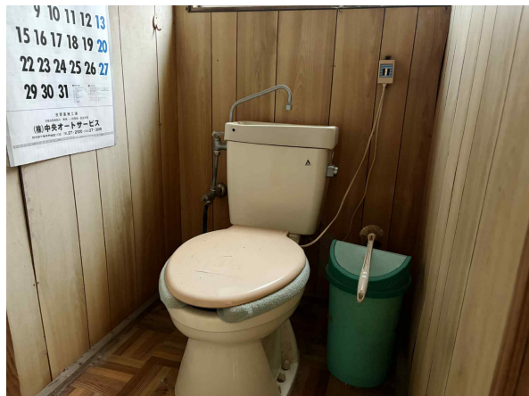
< トイレ >