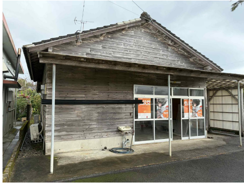
< 外観 >