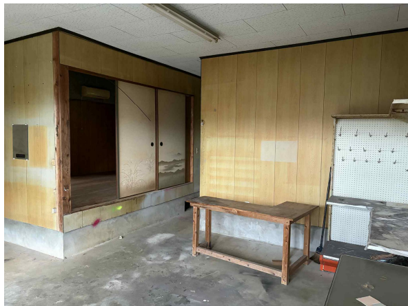
< 土間 >