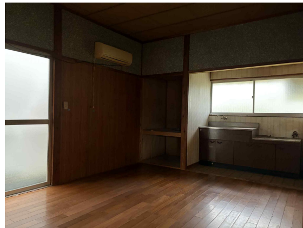
< 洋室 >