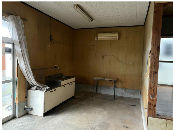
< 土間 >