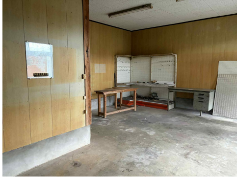
< 土間 >