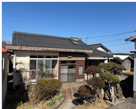
< 外観 >