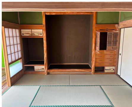
< 和室① >