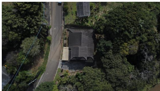
< 空撮 >