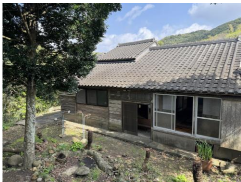
< 外観 >