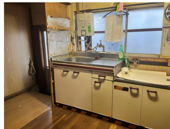
< キッチン >