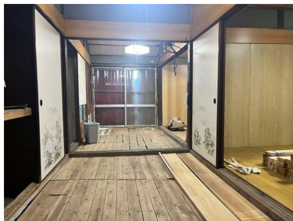
< 和室 >