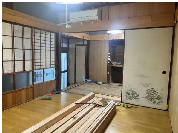
< 洋室 >