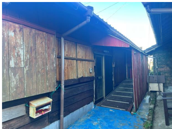
< 外観 >