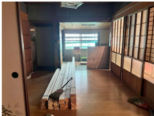
< 洋室 >