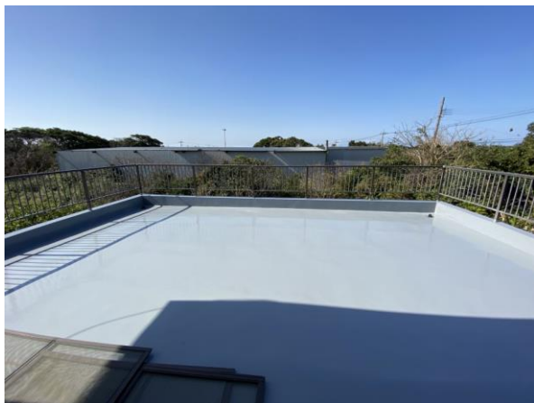
<ルーフバルコニー>